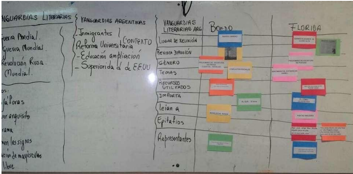
Registro y Sistematización realizada por la Prof. Laura Giménez Miembro del Equipo de TPD IV y Residencia – FCC/UNC

Ejemplo Nº 3: en el tercer caso, que es similar al anterior y con el mismo grupo, en el pizarrón se dispuso un cuadro con diferentes aspectos referidos a movimientos dentro de las vanguardias. Los estudiantes debían completar con las cartulinas de colores de acuerdo a las consignas que iban dando los docentes. (Clase desarrollada en IPEM Nº 9 – Independencia – Año 2016).